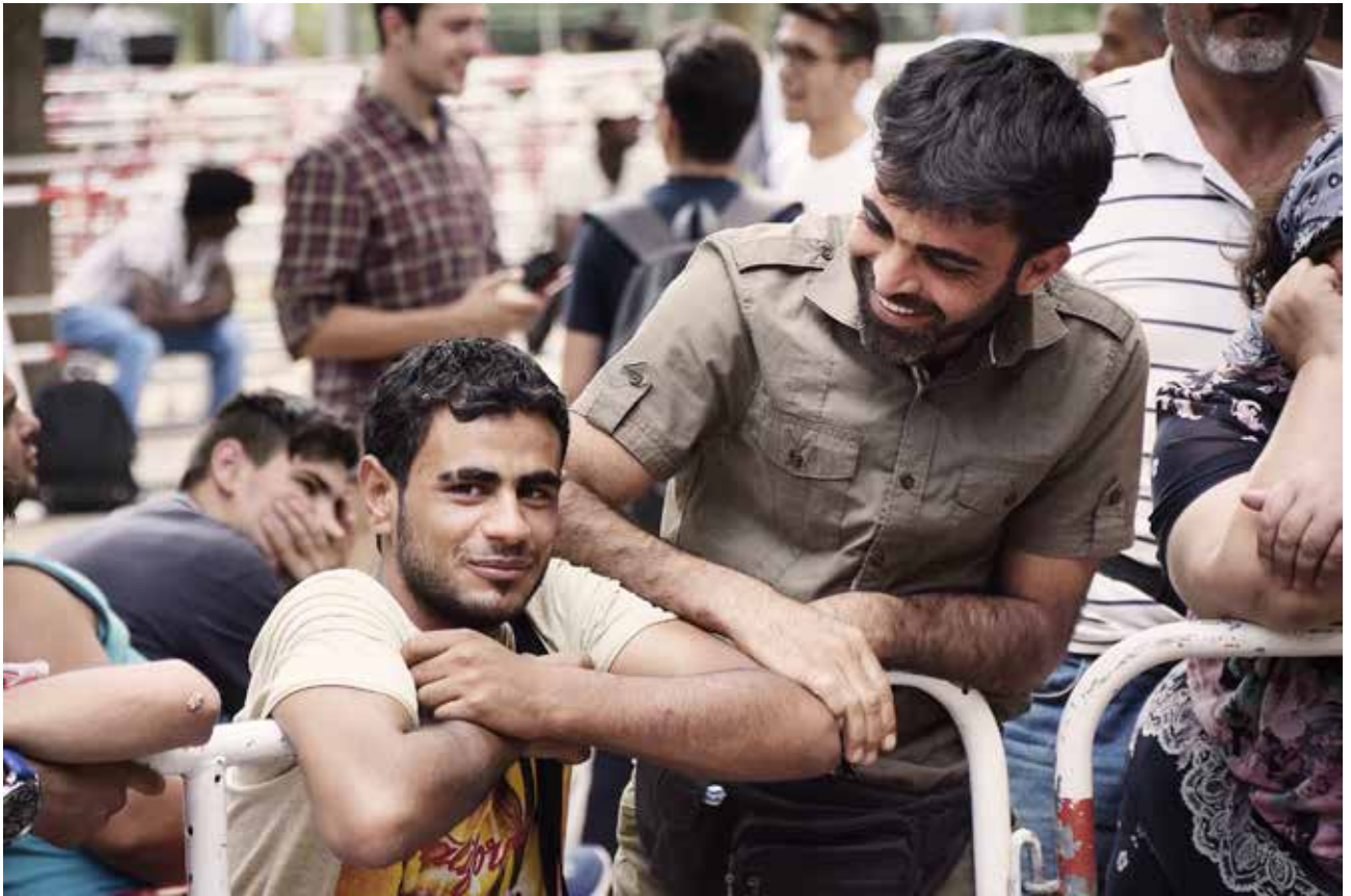
Aus Syrien kommen meist junge Männer wie diese beiden. Ihre Familien sollen später nachkommen

linge zuständig. Das Sagen hat inzwischen die Senatsverwaltung.